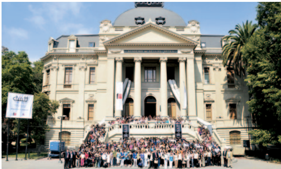
Participantes en el CILELIJ.

En 2009 se puso en marcha, con el apoyo del Gobierno de La Rioja, el proyecto “Escribir como lectores” en Argentina, Chile y Perú con el objetivo de promover la lectura y la escritura entre la población infantil y juvenil.