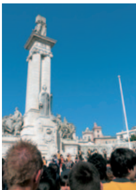
Entrega del premio “¡Viva la Pepa!” (Cádiz).