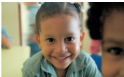
Centro escolar en Santo Domingo (República Dominicana).