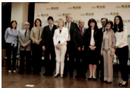
Premio a los profesores de Brasil.

Se premian experiencias docentes novedosas y comprometidas con la educación de los niños y niñas con el objetivo de valorar la tarea del maestro en el aula y de motivar a los docentes en su tarea diaria.