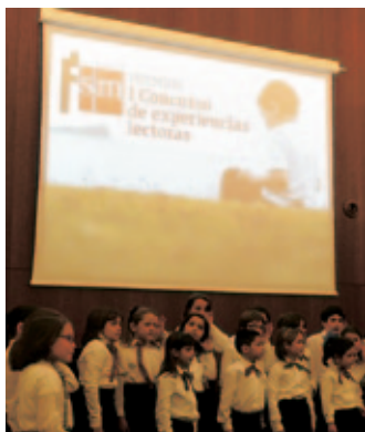
Entrega del premio “Experiencias lectoras”.

El 19 de marzo de 2012 se cumple el bicentenario de la Constitución de Cádiz. Con motivo de este acontecimiento fundamental para la convivencia democrática española, la Fundación SM, el Consorcio para la Conmemoración del Bicentenario de la Constitución de 1812 y el Colegio San Felipe Neri de Cádiz, promueven este Concurso que se celebrará consecutivamente los cursos 2008-2009, 2009-2010, 2010-2011 y 2011-2012.