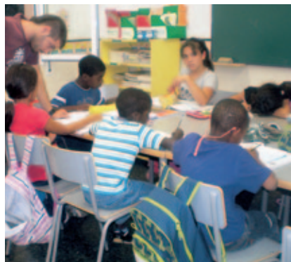
Niños estudiando después de la escuela.