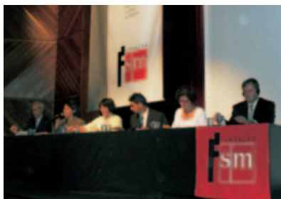
Presentación del informe sobre calidad de la enseñanza (Brasil).