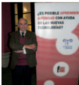
Presentación de Aprender a pensar.

En 2007 la Fundación SM y la Universidad Complutense de Madrid pusieron en marcha una “Cátedra para la Promoción y el Desarrollo de la Lectura y la Escritura” , que recibió el nombre de “Telémaco” . Su objeto es el análisis, la investigación y la docencia de la realidad, problemática y perspectivas del proceso de adquisición, desarrollo y promoción de la lectura y la escritura. Entre las actividades puestas en marcha en la Cátedra figuran la concesión de una beca para tesis doctoral, ciclos de conferencias, un seminario para bibliotecarios y la concesión de varios premios a publicaciones científicas sobre la lectura y la escritura.