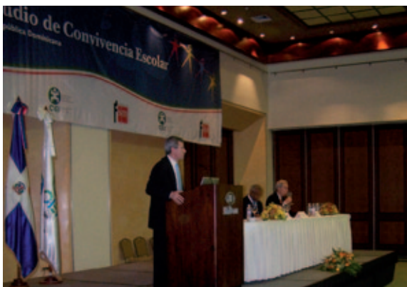
Presentación del estudio de convivencia escolar a profesores (República Dominicana).