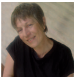
María Teresa Andruetto