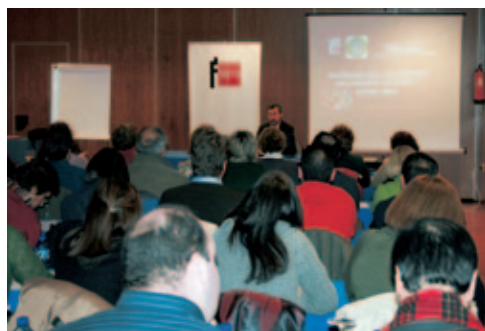
Seminario de Cáceres (España).

El objetivo general del programa es dotar a los profesores de información rigurosa para promover la reflexión, el estudio y la iniciativa en la enseñanza de la Historia de Hispanoamérica en el año del inicio de los bicentenarios que conmemoran las independencias de los países hispanoamericanos y mejorar el conocimiento de la Historia común entre los pueblos y naciones de Hispanoamérica y de España.