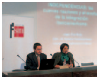
Seminario sobre la historia común de España e Hispanoamérica (España).