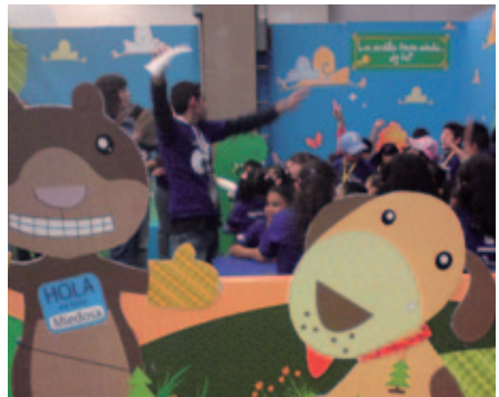
Programa Filantropía (México).