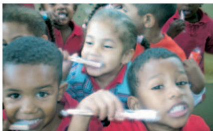
Centro escolar en Santo Domingo (República Dominicana).

Este año la Fundación SM en República Dominicana invirtió sus recursos en dos proyectos con un objetivo común: hacer posible que niños y niñas menores de cinco años puedan ser acogidos durante la jornada laboral de sus madres en centros de educación temprana. Estos centros están ubicados en Los Tres Brazos de Santo Domingo Este (ENDADOM) y en Sabana Perdida de Santo Domingo Oeste (FENDEMUSA). En ambos proyectos la población beneficiada era víctima de violencia familiar.