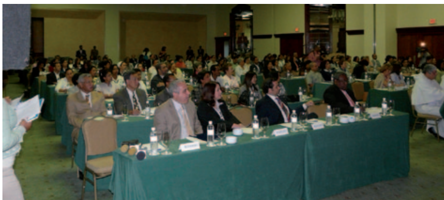
Presentación del estudio sobre convivencia escolar (República Dominicana).

El seminario tuvo como objetivo reconocer el sentido, avances y retos de la función directiva para promover y generar condiciones de cambio en las escuelas y ofrecer una educación de calidad a los alumnos.