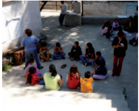
Proyecto ACUDE (México).