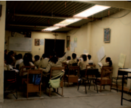
Proyecto "Crea tu espacio" (México).

A través del programa Escritura creativa de niños indígenas , organizado por el Consejo Puebla de Lectura y la Universidad Pedagógica Nacional, la Fundación SM becó a 42 niños y 12 adultos de cuatro escuelas indígenas de Oaxaca para que viajaran a Puebla en un viaje