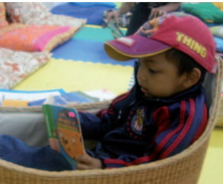
Proyecto Bebeteca (México).