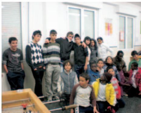
Jóvenes participantes del Proyecto “Sin Mugas”.