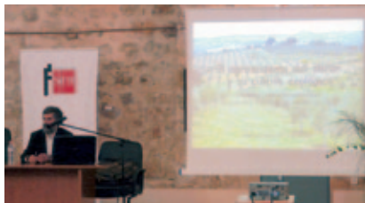
Seminario “Naturaleza y Patrimonio” (España).

En colaboración con la Facultad de Educación de la Universidad de Alicante, la Fundación SM ha puesto en marcha estas jornadas en torno al conocimiento del enfoque competencial del currículo y el desarrollo de las competencias básicas educativas, con el objetivo de ayudar a los profesores y futuros docentes a llevar al aula la práctica de las competencias básicas.