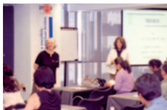
Enseñar a escribir (México).