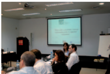
Intercambio de experiencias docentes entre Chile y Argentina.