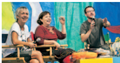
Encuentros entre escritores y lectores (Brasil).

En 2009 abordó la forma en que la lectura tiene un impacto real en la vida cotidiana de las personas: las dota de capacidad de decisión, de empoderamiento para una vida