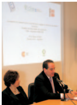
Intercambio de experiencias docentes entre Chile y Argentina.