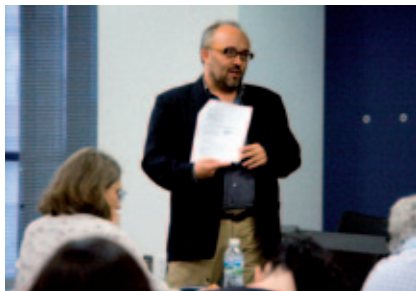
Lectura y escritura críticas (México).

El “quién es quién” en la literatura infantil y juvenil de Latinoamérica de todos los países de habla hispana y portuguesa, con su biografía y obras principales.