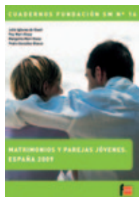
“Matrimonios y parejas jóvenes. España 2009”.