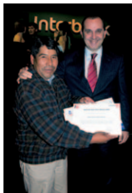
Concurso “Maestro que deja huella” (Perú).