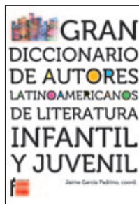
Gran Diccionario de autores latinoamericanos.