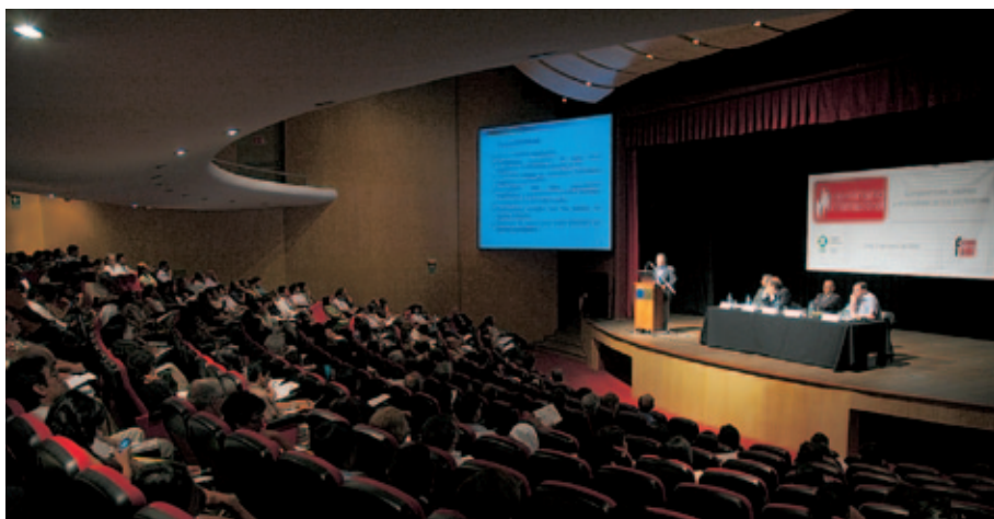
Seminario sobre competencia y valores de los profesores (Perú).

El objetivo del seminario fue ofrecer a los profesores de Educación Básica del Estado de Morelos perspectivas de desarrollo de las bibliotecas escolares y la formación de lectores y escritores que puedan enriquecer de manera directa sus prácticas y realidades profesionales.