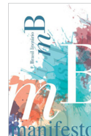
Folheto Manifesto por um Brasil Literário