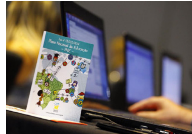
Livreto do Plano Nacional de Educação (PNE)

No ano de 2015, 157 750 pessoas participaram das atividades, e o mote internacional da SAM foi o “Balanço do Programa Educação para Todos (EPT) e Proposição para o pós-2015”. A semana foi realizada de 26 de abril a 2 de maio.