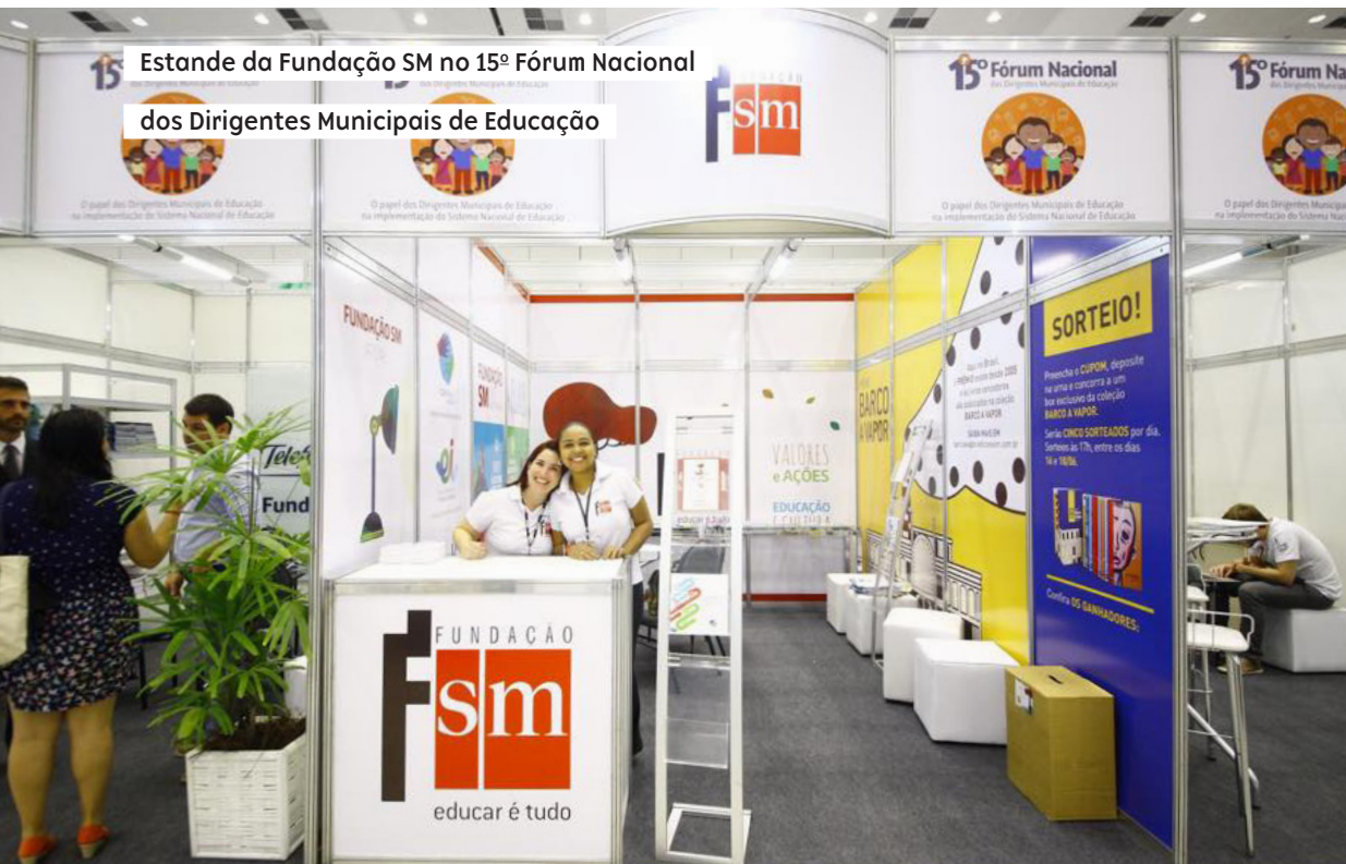
Estande da Fundação SM no 15º Fórum Nacional dos Dirigentes Municipais de Educação

A Fundação SM esteve presente no evento com um estande, no qual divulgou seus projetos, distribuiu brindes e sorteu boxes de livros premiados da Coleção Barco a Vapor . Foram 533 cupons preenchidos para os 15 sorteios realizados.