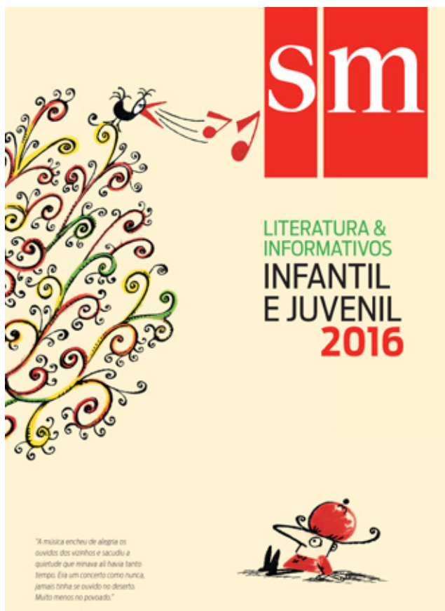
Capa do catálogo de LIJ 2016

O novo catálogo de LIJ foi enviado para mais de 5 000 secretarias de educação e mais de 3 000 livrarias de todo o país.