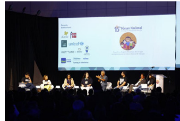
15º Fórum Nacional dos Dirigentes Municipais de Educação

Ao todo, foram quatro dias de atividades, entre conferências, palestras, mesas-redondas, salas temáticas e visitas às salas de atendimento governamental.