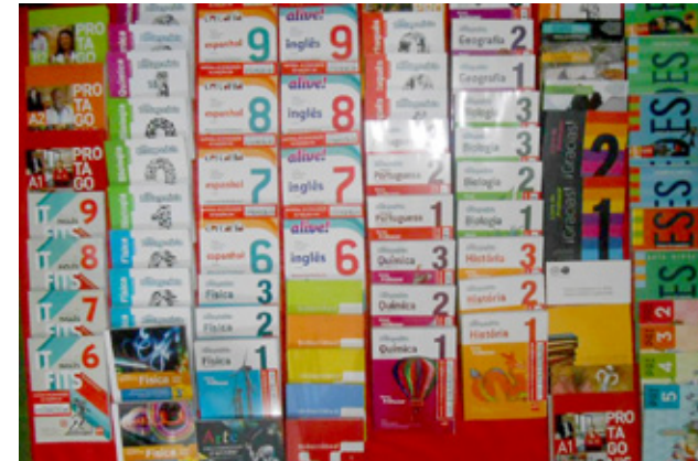
Acervo de livros didáticos doados pela Fundação SM à Biblioteca Comunitária Paulo Freire

Por intermédio da Biblioteca Comunitária Paulo Freire, é possível promover intervenções culturais e artísticas, proporcionando aos moradores do bairro e circunvizinhanças uma opção de encontro com a literatura, o lúdico, o imaginário, o folclórico e a arte para reverter os problemas sociais da população. Fundada em 2006, a biblioteca já contabiliza mais de 5000 visitantes.