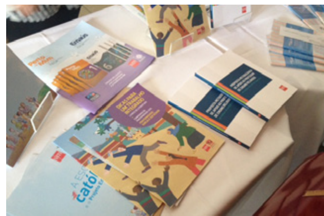
Materiais da SM em exposição no Fórum da ANEC

Nesta edição, o fórum teve como tema central “A identidade da educação católica: 50 anos da Gravissimum Educationis ”.