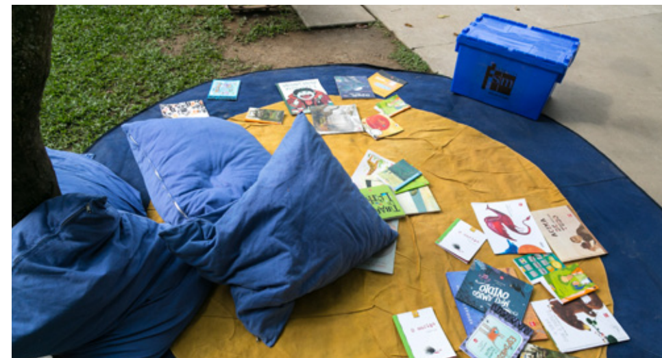
Árvore de livros com obras da SM na FLIPinha

A Fundação SM é parceira da FLIPinha e doou acervo de literatura de Edições SM para a atividade “Árvore de livros”, montada no centro da cidade de Paraty.