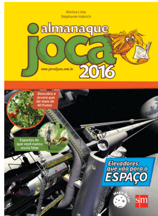
Capa do Almanaque Joca

brasileiro: a inexistência de um jornal voltado exclusivamente para crianças. Trata-se, portanto, de um projeto ousado, pioneiro e de grande contribuição para a formação educacional.