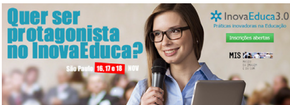
Cartaz de divulgação do InovaEduca3.0

Edições SM participou como patrocinadora do evento InovaEduca3.0, que nasceu da vontade de repensar a atual forma de educar e projetar um futuro onde professores e alunos criem, inovem e adquiram conhecimento juntos. Como inovar o ensino e fazer com que ele acompanhe as rápidas mudanças do mundo? Como preparar o professor para esses novos desafios?