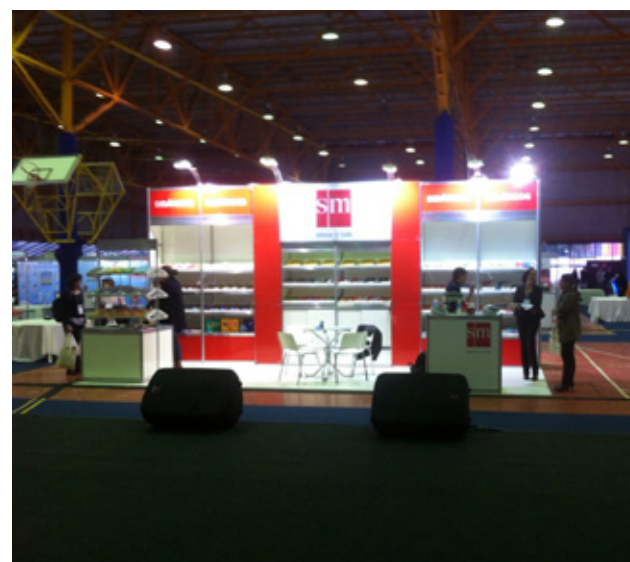
Estande da SM no Congresso Nacional de Escolas Católicas

Edições SM participou como patrocinadora do III Congresso Nacional de Escolas Católicas, promovido pela Associação Nacional de Educação Católica do Brasil (ANEC).