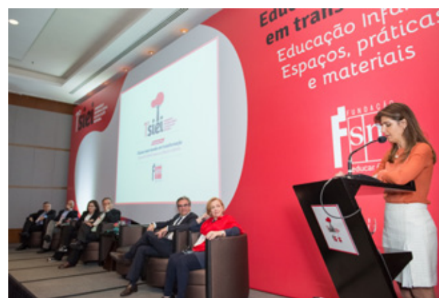
Seminário Internacional de Educação Integral

O seminário aconteceu nos dias 22 e 23 de julho, na cidade de São Paulo, com o tema “Educação Infantil: espaços, práticas e materiais”, e reuniu especialistas brasileiros e internacionais, que debateram a respeito de pesquisas na área, assim como metodologias educacionais e políticas públicas do setor.