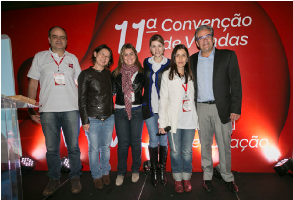
Diretoria SM Brasil

Edições SM realizou, de 9 a 12 de setembro de 2015, a sua 11ª Convenção de Vendas, no Hotel Refúgio Cheiro de Mato, localizado em Mairiporã (SP).