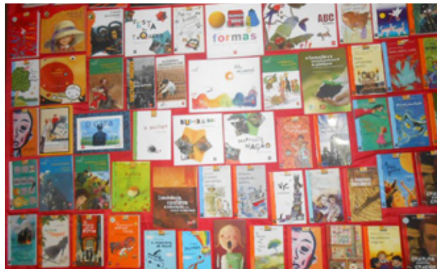
Acervo de literatura infantil e juvenil doado pela Fundação SM à Biblioteca Comunitária Paulo Freire