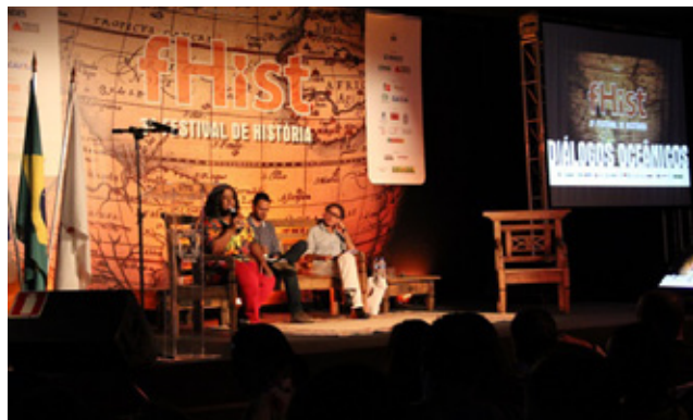
fHist – Festival de História

e personalidades, que puderam estar frente a frente com o público numa instigante jornada de debates entre os dias 20 e 23 de maio. A reflexão e o debate foram pautados pelas raízes históricas, diásporas, diversidades e identidades culturais dos povos de língua portuguesa.