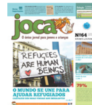
Capa do Jornal Joca

A parceria gerou um novo produto desenvolvido pelas duas editoras: o almanaque Joca. A publicação será distribuída como brinde aos educadores.