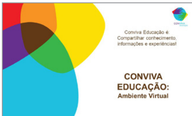
Plataforma CONVIVA Educação

O CONVIVA Educação , plataforma que a Fundação SM apoia, é um ambiente virtual, uma ferramenta tecnológica, totalmente gratuita, que objetiva auxiliar as secretarias municipais de educação a gerir sua rede/sistema de ensino, possibilitando maior foco na gestão pedagógica, fortalecendo o ensino e a aprendizagem.