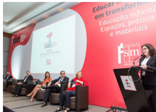
Seminário Internacional de Educação Integral

Com oito edições no México, aconteceu pela primeira vez no Brasil o Seminário Internacional de Educação Integral - SIEI , uma iniciativa da Fundação SM com o apoio de Edições SM .