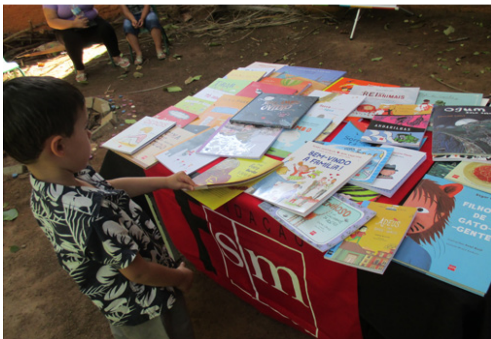
Roda de leitura com o grupo “Ler é uma viagem”

O objetivo da virada é revelar o potencial educador dos territórios em direção à construção coletiva de uma comunidade mais conectada, que percebe o aprender e o ensinar espalhados por todos os lugares.