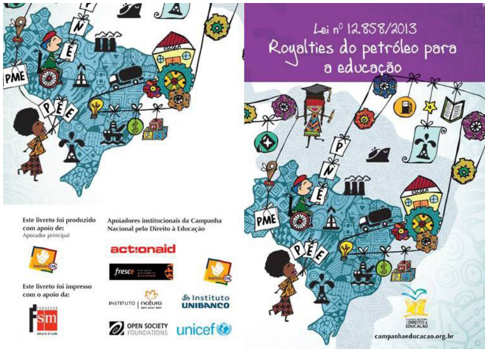
Livreto da Lei n. 12 858/2013 dos royalties do petróleo para a educação

A Semana de Ação Mundial (SAM) é uma iniciativa da Campanha Global pela Educação (GCE), que desde 2003 acontece simultaneamente em mais de 100 países, como uma grande pressão internacional para que líderes e políticos cumpram os tratados e as leis nacionais e internacionais, com destaque para o Programa de Educação para Todos (Conferência Mundial de Educação, Dacar/Senegal, Unesco, 2000) e os Objetivos de Desenvolvimento do Milênio (ONU, 2000), para garantir educação pública de qualidade para todos.