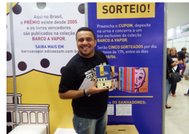
Ganhador de sorteio no estande da Fundação SM