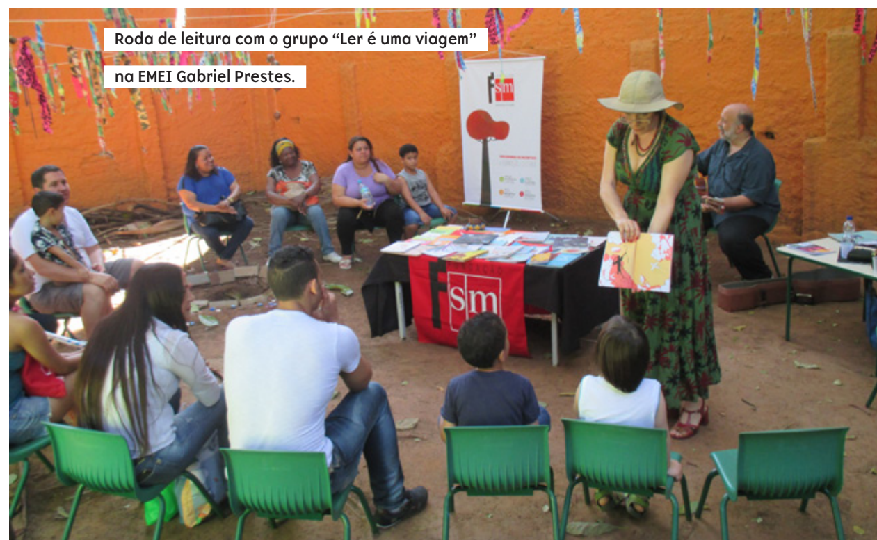
Roda de leitura com o grupo “Ler é uma viagem” na EMEI Gabriel Prestes.