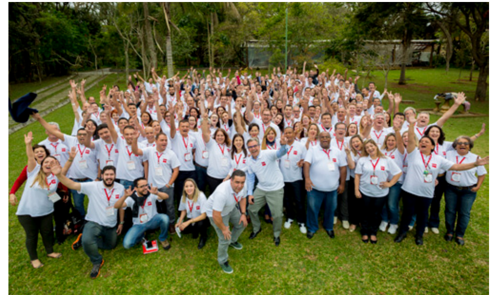
Colaboradores da SM Brasil

Durante a programação, foram realizadas diversas atividades de confraternização entre os participantes, e integrantes da área comercial foram homenageados pelos resultados obtidos.